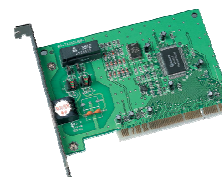
Réf. : X042FWPCI

Tous les avantages du Numéris dans notre carte interne au format PCI :