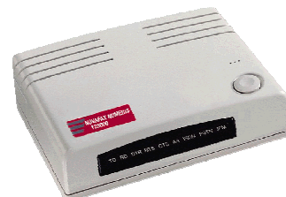
Réf. : X040ZWBX

Avec Numéris, le temps d'établissement d'une communication est de 3 secondes ce qui accélère considérablement les applications telles que la navigation sur le web, la messagerie, le transfert de fichiers important (images, son, vidéo, ...). Ainsi vous pouvez profiter pleinement de l'Internet Haute Vitesse même si vous êtes dans une zone non couverte par l'ADSL.